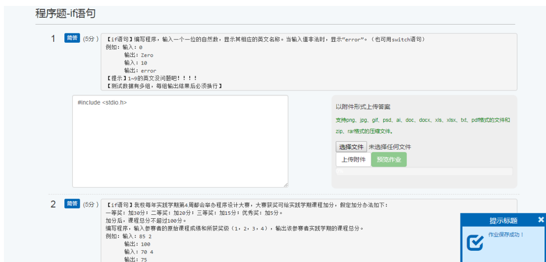
图 6 “保存成功”提示

注意此提示非常关键，特别是 1,2 小点。比如在答简答题的时候，需要确保右下角出现“保存成功”提示，如图 6 所示。如果答案改变后，但未出现“保存成功”提示，需要在页面的空白处单击，即可看到提示。