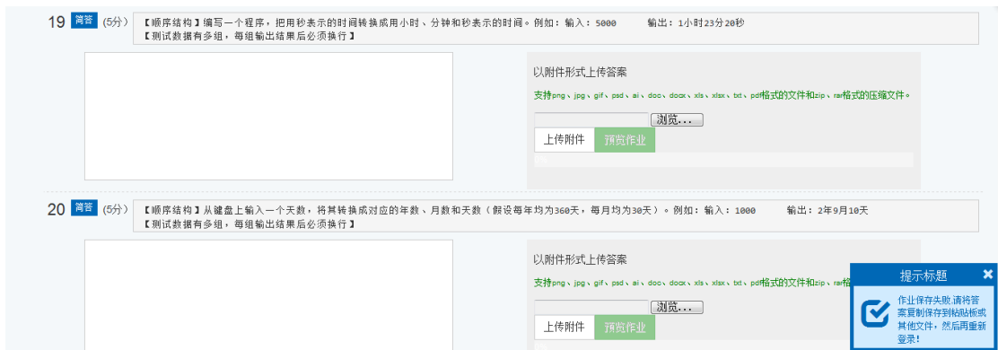
图 7 “保存失败”提示

在图 8 “做题页面”，做完题目后，可以选择“暂存”或者是“保存”，来保存结果。