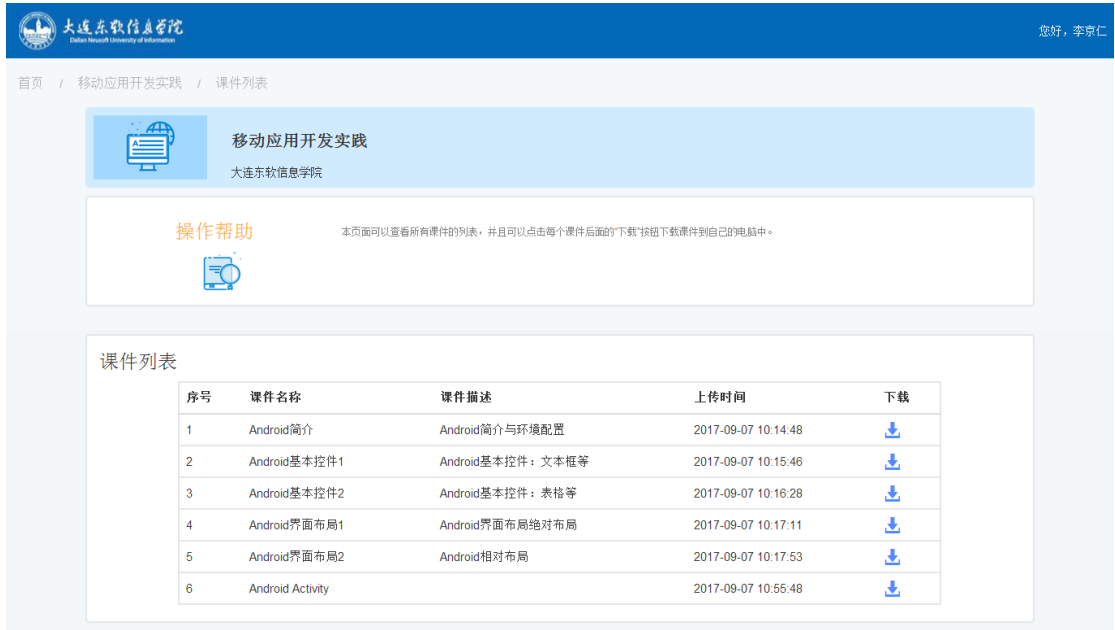
图 9 课件列表