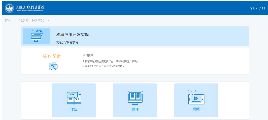
图 2 一门课程的学习页面