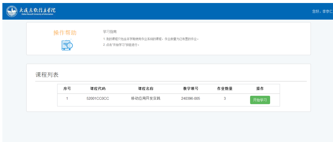
图 1 我的课程页面

登陆成功在图 1 “我的课程” 页面可以看到所学的所有课程，点击 “开始学习” 按钮，进入图 2 “一门课程的学习页面”。