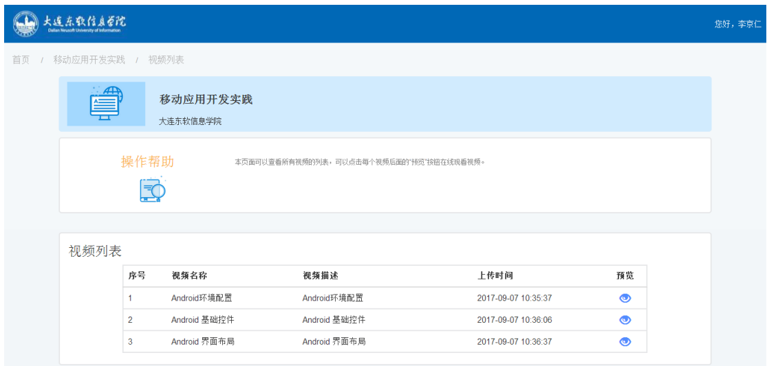
图 10 视频列表

在图 2 “一门课程的学习页面”, 点击“视频”, 进入到该门课程的图 10 视频列表, 点击“预览”, 进入图 11 “视频播放”页面。