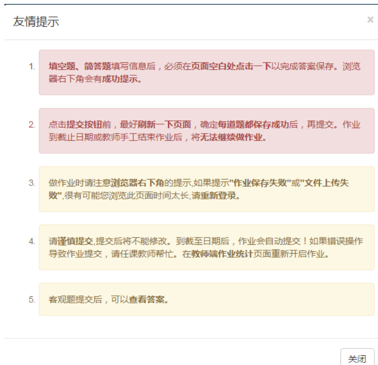
图 5 友情提示

注意此提示非常关键，特别是 1,2 小点。比如在答简答题的时候，需要确保右下角出现“保存成功”提示，如图 6 所示。如果答案改变后，但未出现“保存成功”提示，需要在页面的空白处单击，即可看到提示。