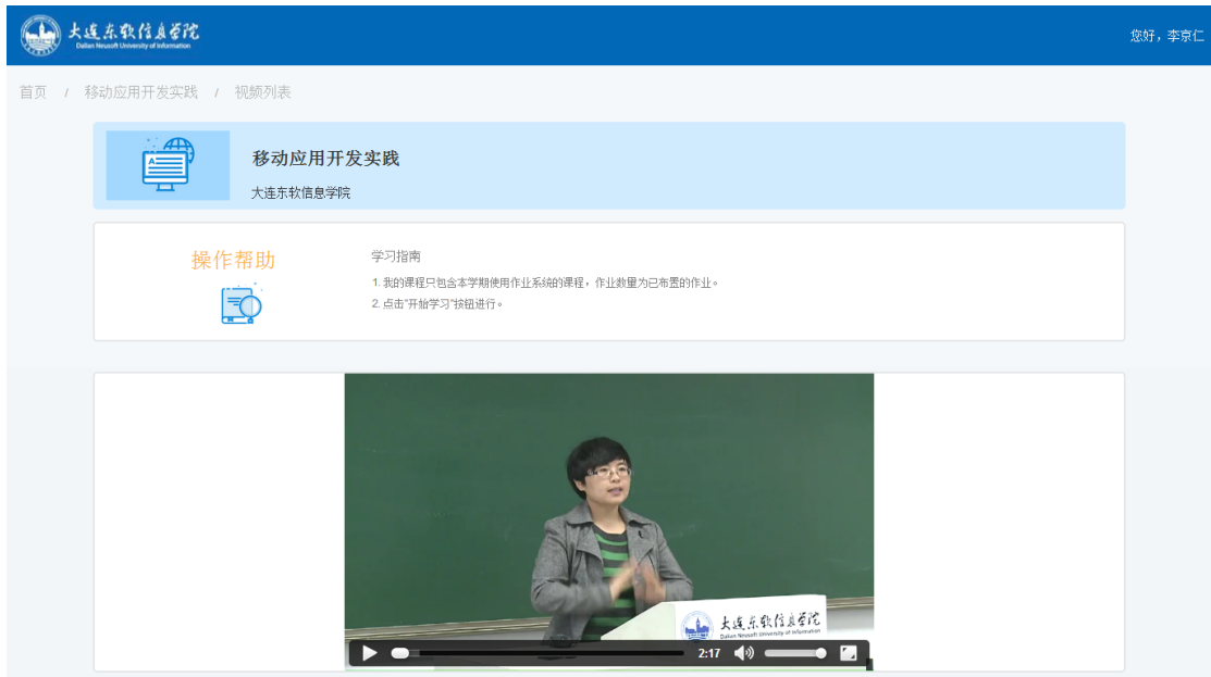
图 11 视频播放页面