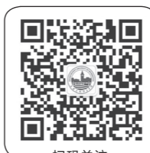
扫码关注 大连东软信息学院 官方微信公众号 dnu2000